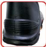
WSPORNIK ZE SKÓRY LICOWEJ