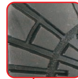
ANTIPOŚLIZGOWA PODESZWA SRC